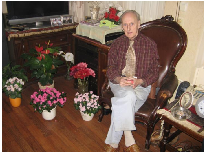
Vele bloemen sieren zijn kamer...

heel toepasselijk wordt hij niet Kees maar BOB genoemd. Samen ondernemen ze allerlei activiteiten, vertellen elkaar hun verhaal, delen lief en leed, zijn na verloop van tijd kameraden geworden. Kees is jarenlang marktmeester geweest, dus hoeft het geen be- toog dat ze samen, bijna elke woensdag, op de markt in wijk De Besterd, worden aangetroffen. Zijn gezondheid laat helaas vooral de laatste maanden te wensen over. Onlangs zijn tumoren aangetroffen in lever en pancreas, die niet of nauwelijks meer