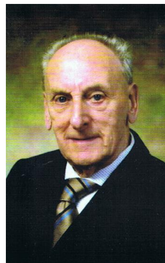
† 13 november 2016

Helaas, Ad is ontvallen op zondag, 13 november 2016, 's morgens om 05.00u. Vorige week nog vroeg hij of we afscheid kwamen nemen. Samen met onze secretaris gingen we bij hem op bezoek, dronken koffie, haalden herinneringen op uit het verleden en bespraken het wereldnieuws... Want ondanks dat zijn lichaam werd verteerd door alsmaar voortwoekerende kwaadaardige tumoren bleef zijn geest optimaal functioneren. Verbazingwekkend zo helder als hij was, op zijn leeftijd, bijna 90 jaar. Met realisme en karakter sleept hij zijn loodzware last de laatste jaren met zich mee, maar helaas, langzaam maar zeker laat zijn vechtlust hem in de steek en verlangt hij naar een vredig einde. Zijn wensen worden verhoord, hij neemt afscheid van familie en zijn Wapenbroeders en slaapt vredig in, onze Sobat is uit zijn lijden verlost. Zo waardig mogelijk en met respect, heeft de Bond van Wapenbroeders met zijn dodenwacht, compleet met banier, afscheid genomen van onze vriend en veteraan, hij ruste in vrede.