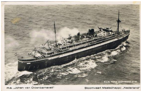
M.S. Johan van Oldenbarnevelt 1947

Door: Jacques van de Ven, 20 maart 2013.