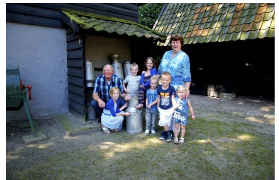
Trotse Oma en Opa met de kleinkinderen