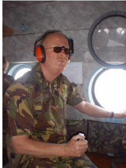
Vliegen met de heli over Bosnië