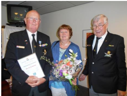
Uitreiking Bondskruis 2016

28 april 2004 wordt hij lid van de Bond van Wapenbroeders, Afdeling Midden Brabant. De leden laten er geen gras over groeien, de volgende dag wordt hij in hun ledenvergadering, gekozen tot voorzitter, een job die hij tot op heden met verve en elan pleegt te doen. Hij houdt lezingen op scholen, is voorganger bij herdenkingen, bezoekt zieke kameraaden en houdt toespraken bij het overlijden van collega's. Schrijft stukjes in het veteranenblad Wapenbroeders, organiseert, delegeert en regeert. Het Hoofdbestuur van de Bond belooft hem in 2010 bij het 60 jarig bestaan van de afdeling met de Bondsmedaille en onlangs nog, tijdens de ALV, met het Bondskruis van Verdienste. Een mooie en terechte waardering voor deze loyale bestuurder waarop men altijd een beroep kan doen en doet.