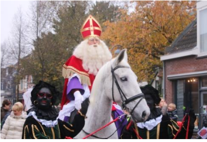
Intocht Sint Nicolaas Goirle