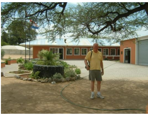
Nieuwe school Namibië