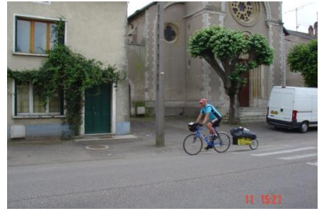
Bede(l)vaart fietstocht 3000km