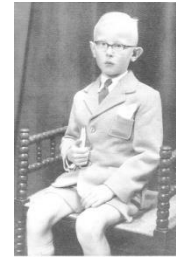
1e Heilige Communie