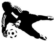
Prima doelman !

Na de lagere school gaat hij naar de M.U.L.O., is daar zeer sportief bezig, maar heeft mede door zijn enorme inzet, af en toe vervelende blessures.