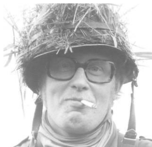
Een echte soldaat...

Hij maakt furore bij de Koninklijke Landmacht, is een krijgsman in hart en nieren, een 'zandhaas' pardon, echte Infanterist, kent de Loonse en Drunense duinen op zijn duimpje. Hij volgt de nodige opleidingen met goed gevolg.