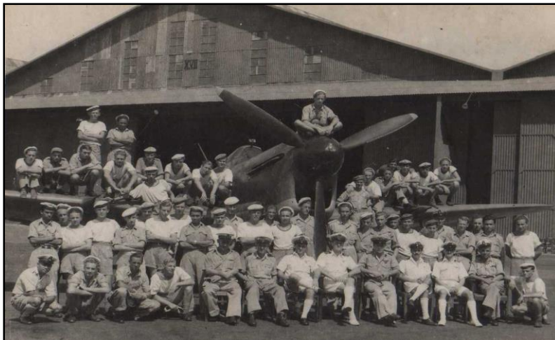
860 Squadron / squadron Fire Fly