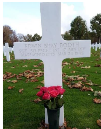
Geadopteerd graf in Margraten

Met de Coördinator Erfgoed Tilburg zijn wij momenteel bezig om een aanvraag voor een bijdrage in de kosten te doen. Echter, zij wil vooraf weten of er wel behoefte bestaat aan een dergelijke stichting.