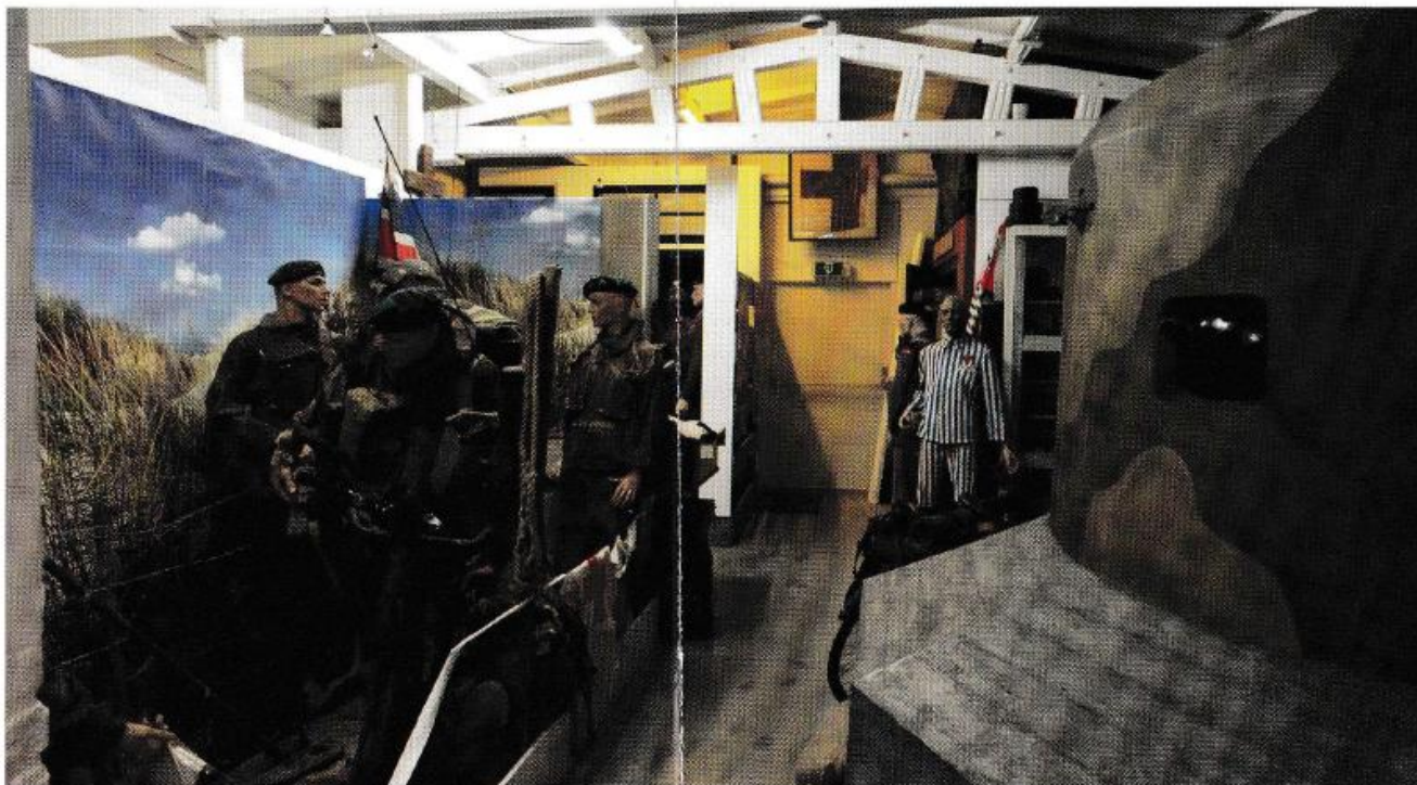
De landing bij West-Kapelle met rechts een nagebouwde bunker

Hij bestaat uit uniformen, onderscheidingen, zend- en radio-apparatuur, wapens, gebruiksvoorwerpen, surrogaten, munitie, mijnen, handgranaten, optische apparatuur enz.